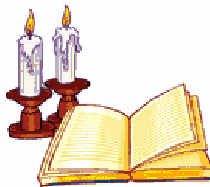
Debemos usar lo que Dios nos ha dado, sin criticar a los demás

Somos un solo c _____, el cuerpo de C _____. Dentro de este cuerpo hay diferentes m _____. Si todos tenemos los mismos talentos, las mismas h _____, sería un cuerpo que sólo